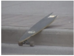
● 疑遭的士恶意冲撞 多